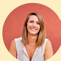
Executive Director of Marketing Forever Living Products

Ich hoffe, dass dich diese Ausgabe dazu inspirieren wird, den Entschluss zu fassen, mehr von der Welt zu sehen und deinen Blickwinkel zu erweitern. Wie wir bei Forever immer sagen: Suche das Abenteuer! Nichts erfrischt den Geist und beflügelt die Phantasie so sehr wie das Verlassen der eigenen Komfortzone.